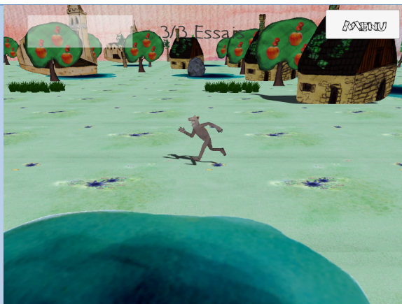
Maman j'ai raté le bûcheron.

http://philippeberreur.wixsite.com/monsite/copie-de-zombies-want-to-eat-your-f