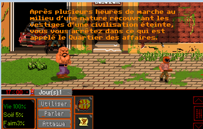
Fin de Pétrole

http://philippeberreur.wixsite.com/monsite/games